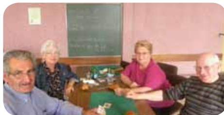
Le «grand vendredi» au club de l'amitié et du temps libre