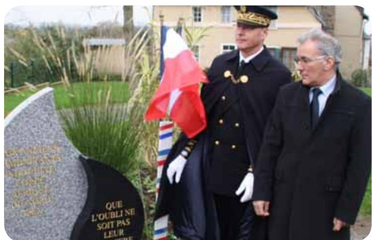
Inauguration de la stèle AFN