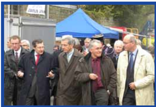
La foire Saint-Martin en images