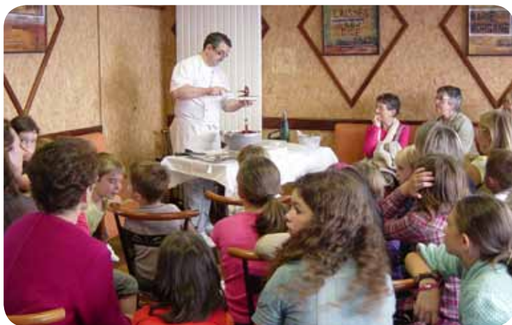
Art en Bars 2011