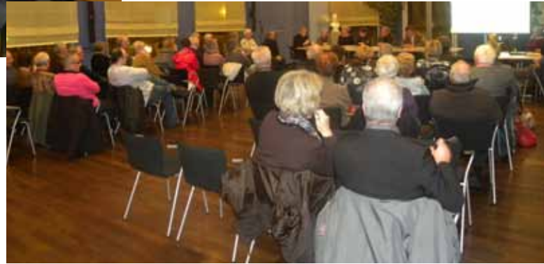
Assemblée plénière du Conseil consultatif des séniors Décembre 2011 à l'Hôtel de ville

Des actions (jeux de société, etc...) sont également proposées au sein de la commission socio-culturelle. Ces activités, qui ont lieu les premiers, troisièmes et cinquièmes jeudis après-midi de chaque mois, rencontrent un vif succès avec plus de 25 participants réguliers.