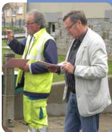
Jury des maisons fleuries