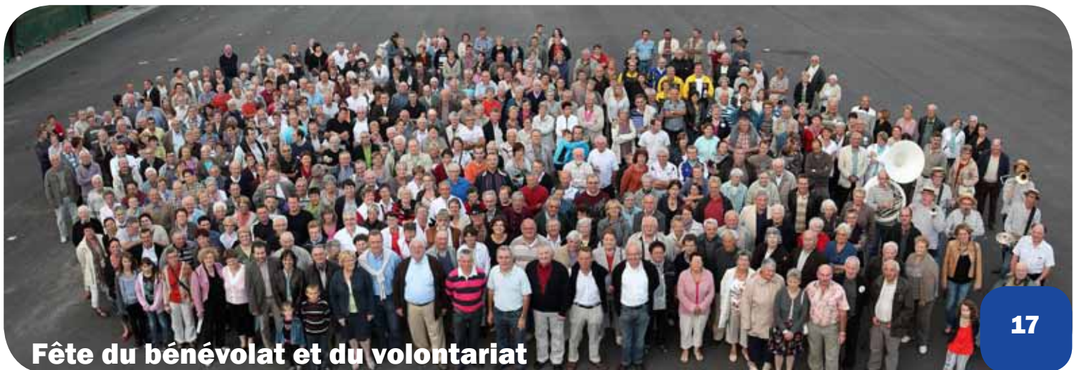
Fête du bénévolat et du volontariat