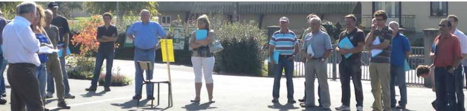
Journée de formation à Marly portant sur les bonnes pratiques d'application phytosanitaire - Juin 2011

Extrait de la Charte qui compte en tout 13 règles distinctes à respecter.