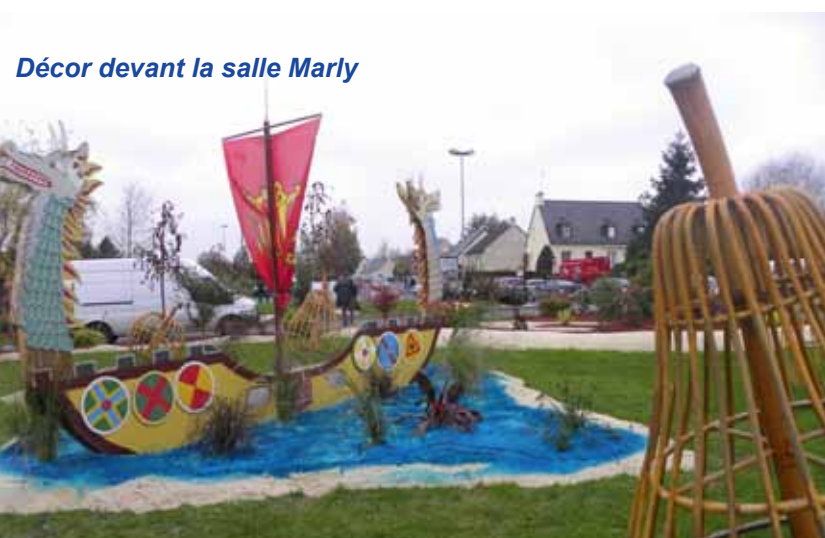
Décor devant la salle Marly