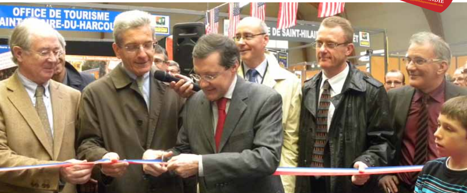
Inauguration de la Foire Saint-Martin 2011 par Monsieur le Préfet de la Manche, les parlementaires et les élus