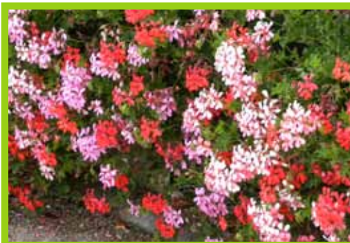
Concours des Maisons Fleuries