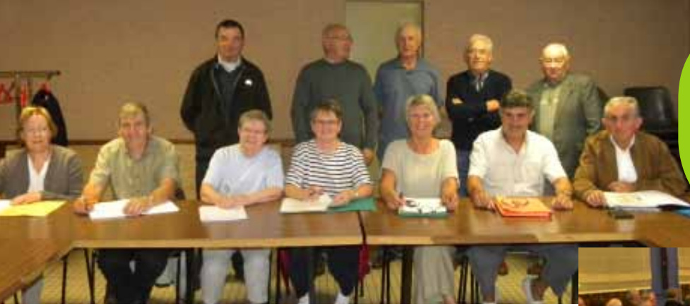
Conseil consultatif des séniors, octobre 2011