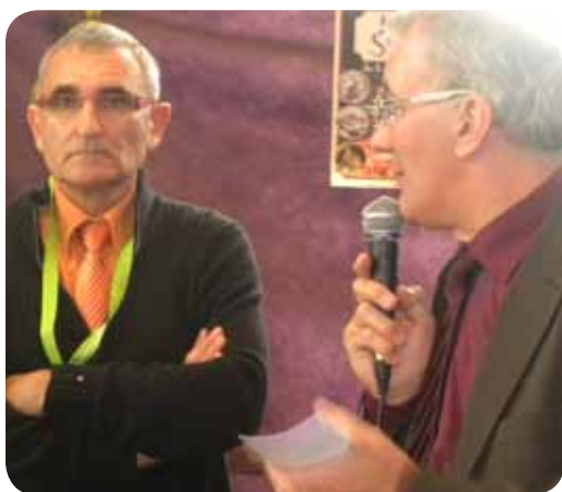
Inauguration de la Foire Saint-Martin

Piloter la politique municipale en matière de sécurité routière, coordonner l'action de la police municipale de façon à développer les actions de prévention, suivre la convention « gendarmerie/police municipale », renforcer les mesures relatives à la sécurité des personnes et des biens, avec le concours de la police municipale et de la gendarmerie, mettre en place et suivre le CISPD (Conseil Intercommunal de Sécurité et de Prévention de la Délinquance).