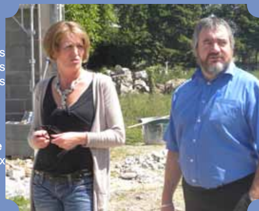
Rencontre avec l'AFPA