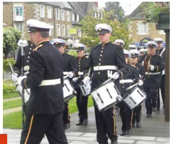
Fête de la musique 2011 Délégation de Zierikzee

Vendredi 29 et samedi 30 : Exercices publics par le Conservatoire, salle du Rex.