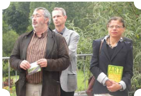
Inauguration de Art et Sentiers