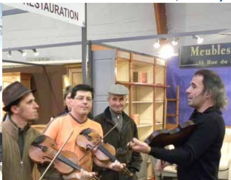
Représentation du groupe La Loure, Marly