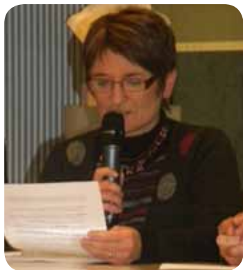
Séance plénière du Conseil consultatif des séniors