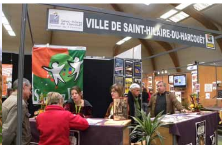
Stand de la ville et de l'Office de tourisme, Salle Marly