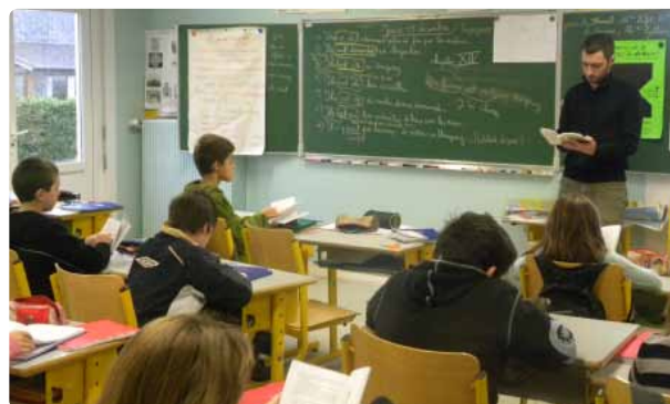
Ecole primaire Beauséjour - Décembre 2011