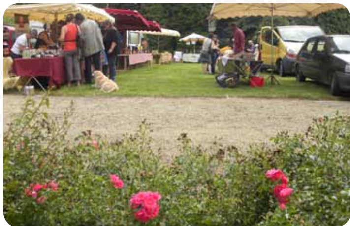
Marché développement durable dans les jardins de la Verrière