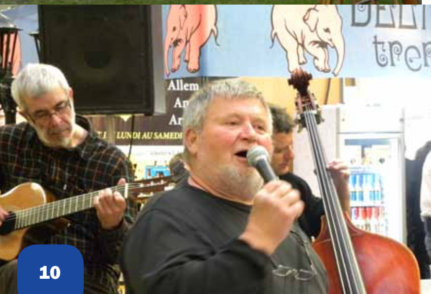
Représentation du groupe Magène, Marly