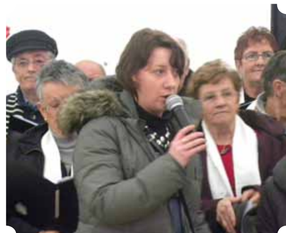
Marché de Noël 2011

Coordonner les manifestations et animations sportives locales, assurer la gestion et le suivi des équipements sportifs (occupation des locaux, travaux, etc...),