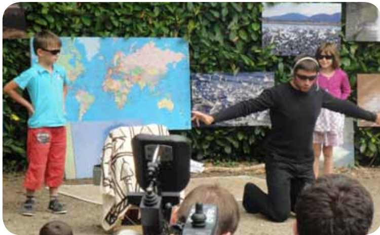
Animation estivale au Jardin des Vallons