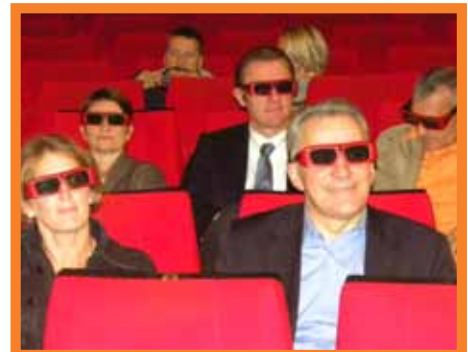
Le cinéma passe à la 3D numérique